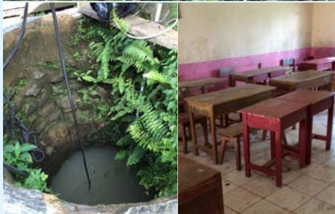
Huidige watervoorziening (voordat het project startte) en een klaslokaal.

en ontstaan uit een fusie van Inowa Bandung en WLN Indonesia te Manado). Dit is een dochter van de Waterleidingmaatschappij Drenthe (WMD) en heeft in Bandung 30, in Manado 55 en in Bogor 6 medewerkers. WLN Indonesia heeft een management team bestaande uit twee Indonesiërs en een Nederlands ingenieur.